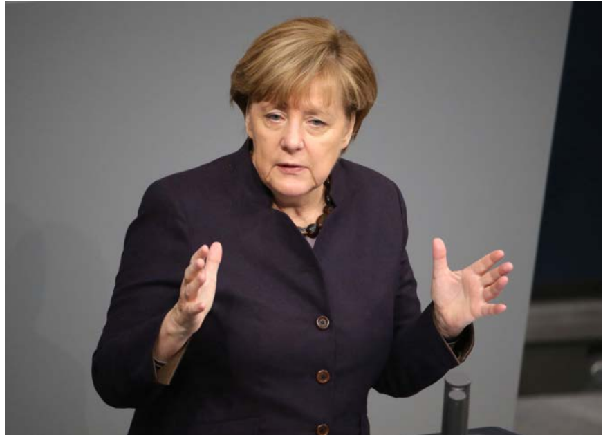
Kanzlerin Angela Merkel in der Generalaussprache zum Haushalt 2016

Merkel nannte ein ganzes Bündel an Maßnahmen, die die Europäische Union zügig angehen müsse: so die Sicherung der Außengrenzen, die zügige Einrichtung von Registrierungscentren – sogenannter Hotspots – in Griechenland und Italien sowie ein faires System zur Verteilung der Flüchtlinge auf die Mitgliedstaaten. „Die solidarische Verteilung der